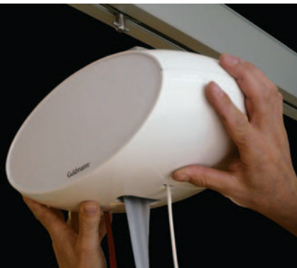
GH1 Q – med snabbkoppling

GH1 Q lyftmodul har ett snabbkoppling system som gör det mycket enkelt att sätta i eller ta ur lyftmodulen från skenorna, när det är önskvärt att flytta lyften till ett annat rum eller bostad. Inga som helst verktyg behövs för att flytta lyftmodulen.