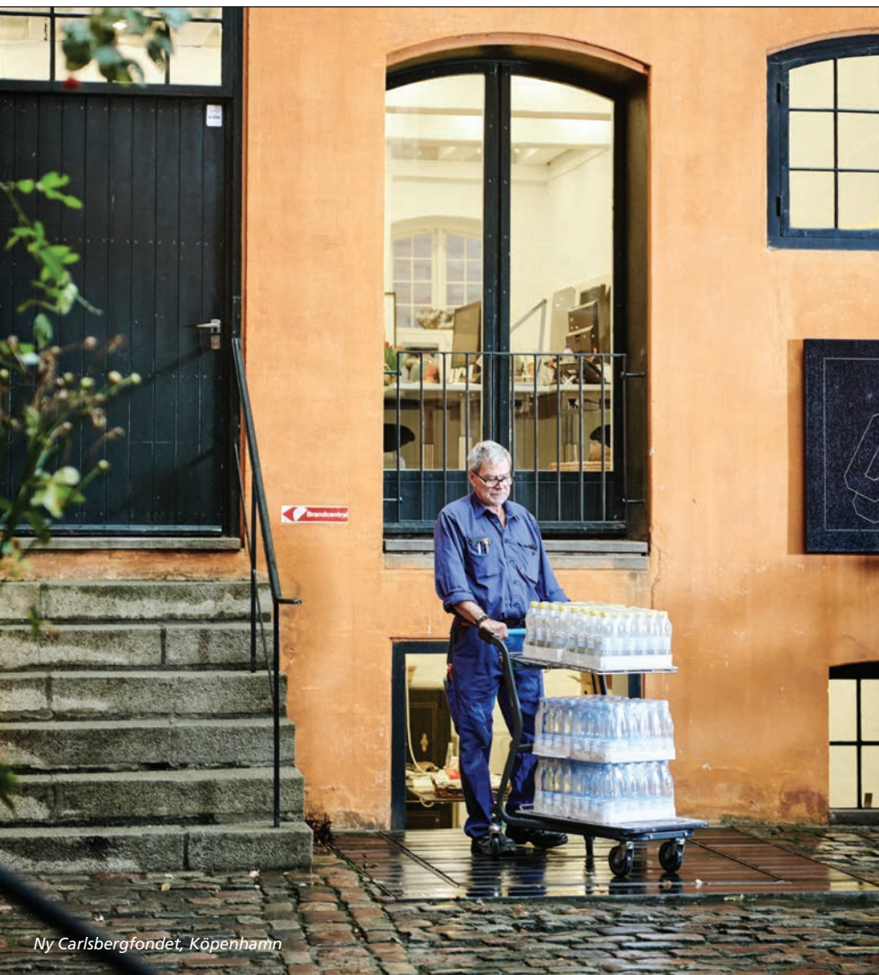
Ny Carlsbergfondet, Köpenhamn