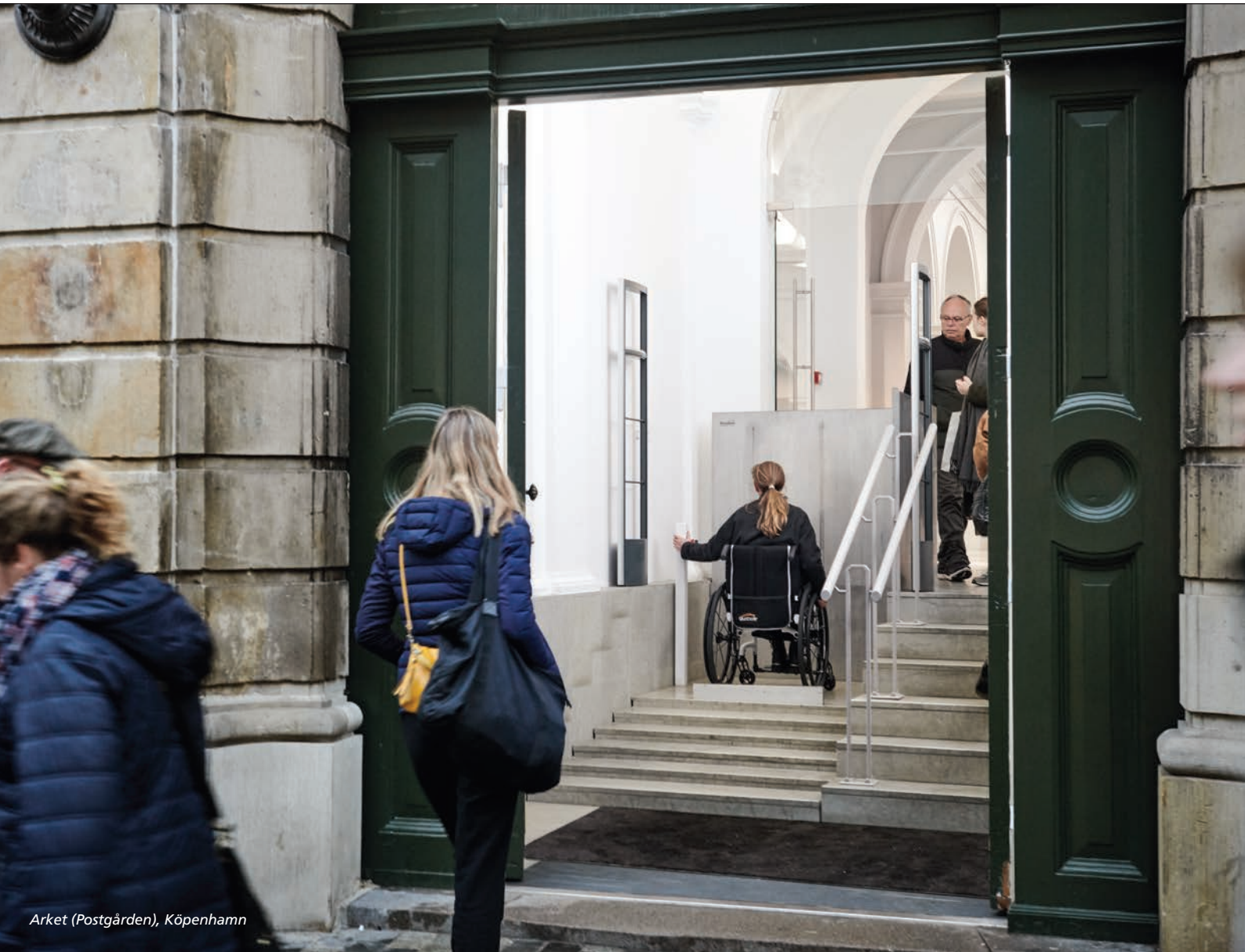
Arket (Postgården), Köpenhamn