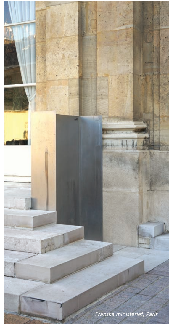
Franska ministeriet, Paris

När användaren trycker på knappen för att använda SLP E-plattformen stiger säkerhetsvärn automatiskt och trappstegen förvandlas till en plattform. Lyftplattformen är sedan klar för användning och kan höjas och sänkas med hjälp av manöverpanelen. Det finns flera valmöjligheter för placering av kontrollpanelen.